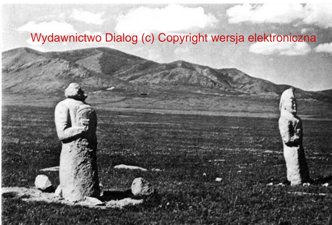
Baby kamienne Dawnych Turków (Mongolia)